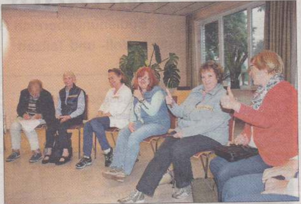
Gut besucht waren die ersten Treffen des Generationennetzwerks Dissen/Bad Rothenfelde.